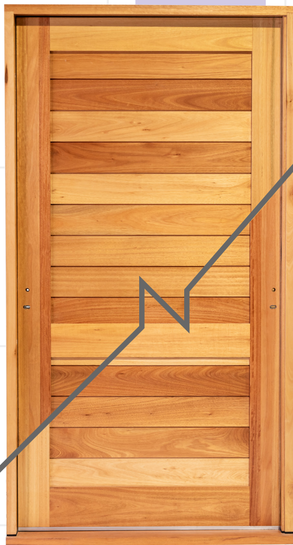
VISTA DE FRENTE

Suspensores de goma en cabezal, travesaño y zócalo.